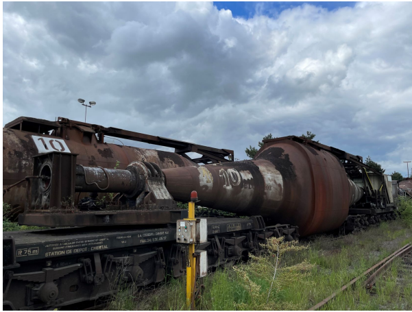
sauvetage d'un wagon « torpille » pour le site de Chertal avec la Maison de la Métallurgie

La valorisation et conservation du patrimoine ferroviaire sont au cœur des préoccupations de votre entreprise.