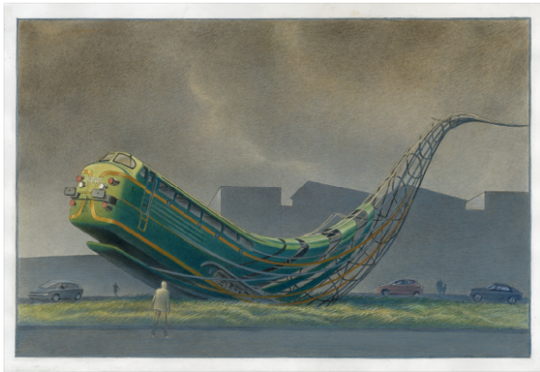
©Collection Train World Heritage – SNCB – François Schuiten - Sculpture ferroviaire